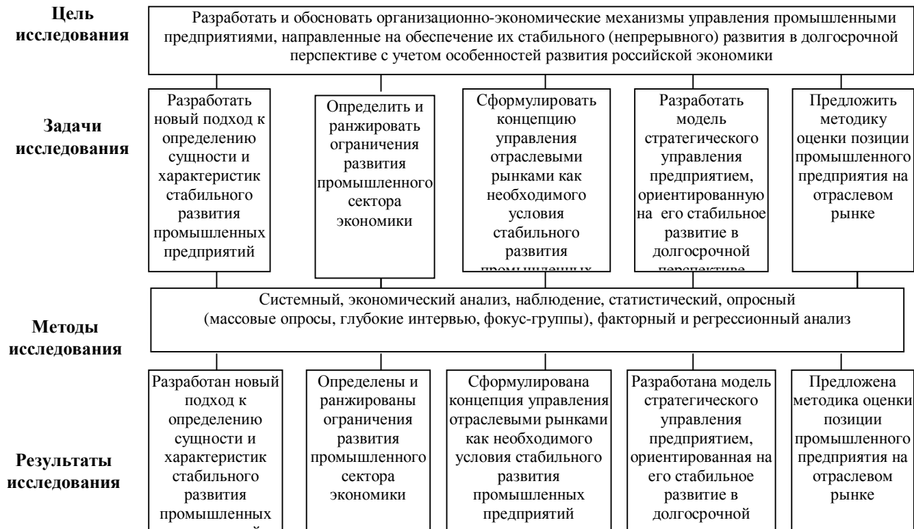
Рис. 2. Схема диссертационного исследования