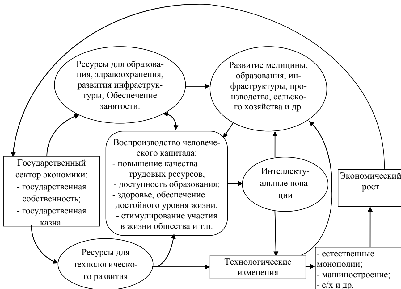
Рис. 2. Общая схема влияния государственного сектора экономики на воспроизводство человеческого капитала, технологические изменения и рост экономики

В работе рассматриваются не только выгоды трансформации государственного сектора, но также политические, социальные, экологические (институциональные и транзакционные) издержки ее проведения.