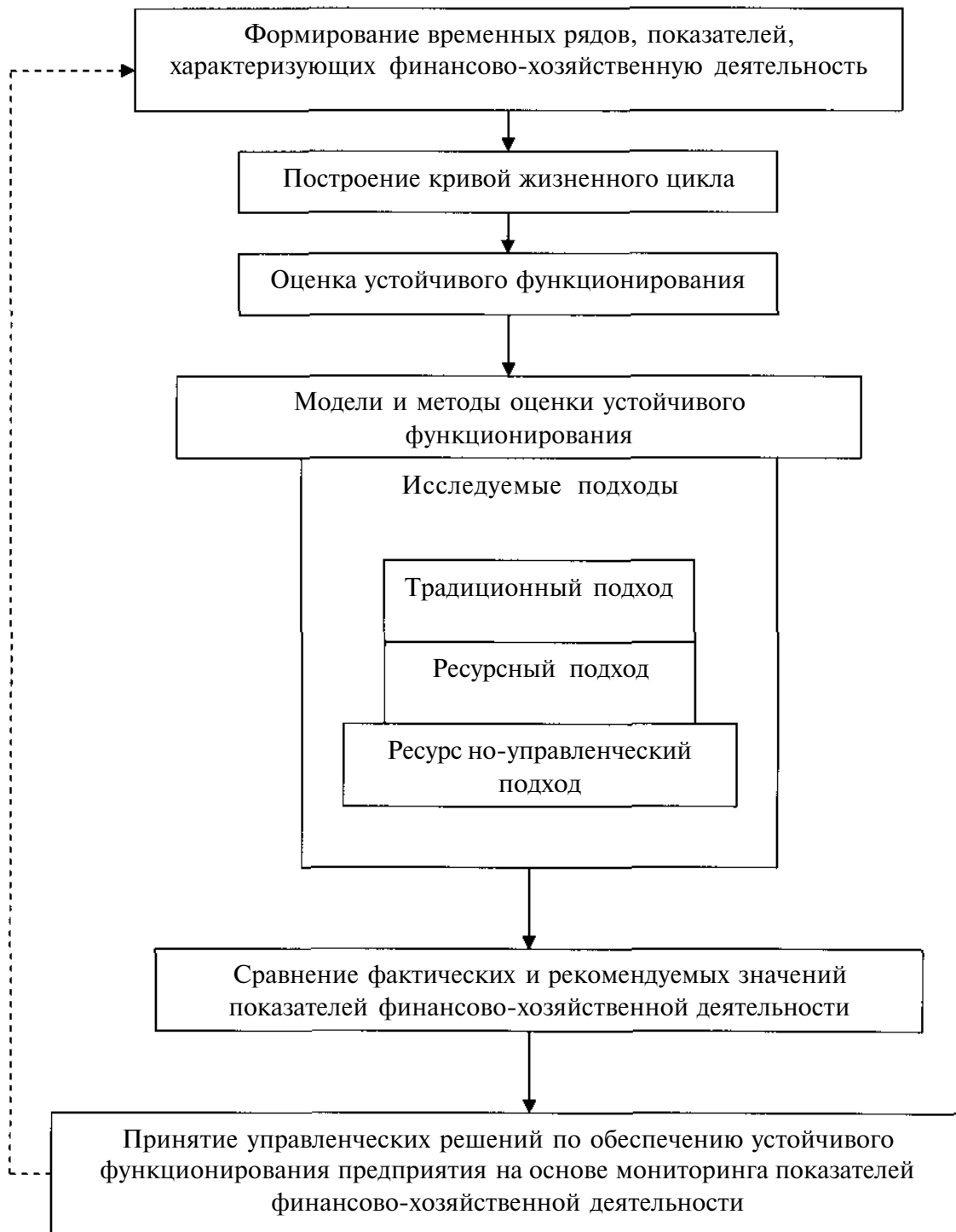
Рис. 3 Блок схема управления устойчивым функционированием предприятия