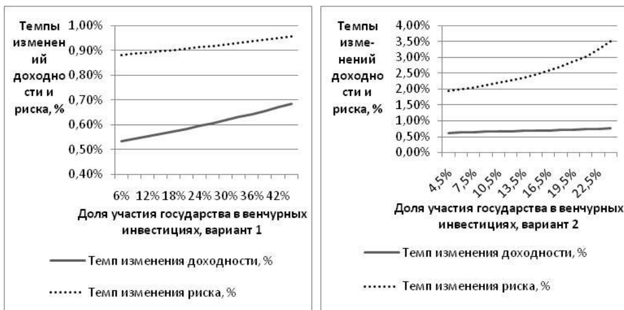
Рисунок 2. Зависимость доходности и риска частных инвесторов венчурного фонда «БИН» от величины используемого финансового рычага

Принципиальные отличия разработанной методики оценки финансового рычага при использовании заемных средств, предоставляемых государством частным инвесторам, состоят в следующем. Во-первых, изучается влияние финансового рычага за счет использования заемных средств, предоставленных на льготных условиях (меньшая процентная ставка). Во-вторых, рассмотрены два варианта государственной поддержки: на этапе инвестиций в начинающие компании, и на этапе инвестиций в быстрорастущие компании. Последнее отличие позволило выявить факторы, способные спровоцировать финансовый кризис в отрасли из-за недооценки рисков со стороны инвесторов.