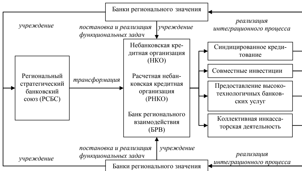
Рис. 2. Организация функционально-сетевой интеграции банков регионального значения на основе дочерних сетевых структур

В результате проведенного сопоставления были выделены функциональные задачи по каждой форме (табл. 2).