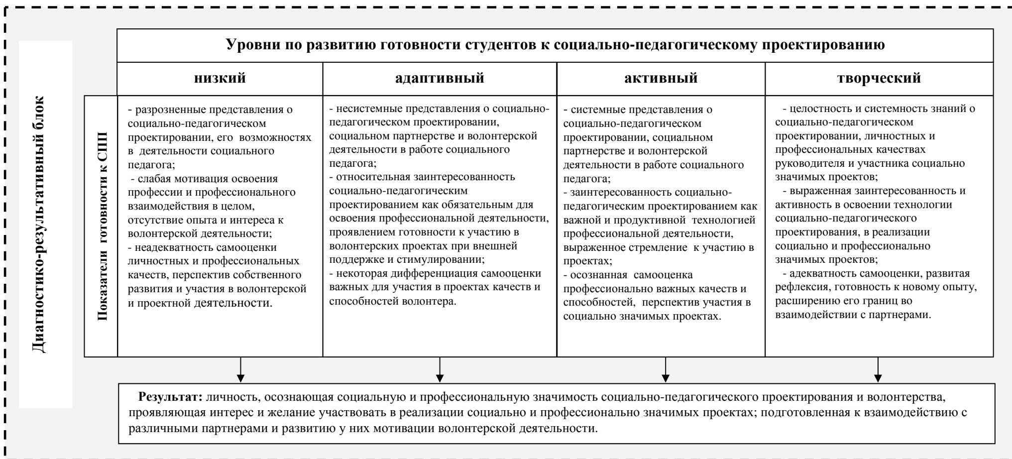
Рис. 1. Модель развития готовности студентов к социально-педагогическому проектированию в процессе профессионально ориентированной волонтерской деятельности