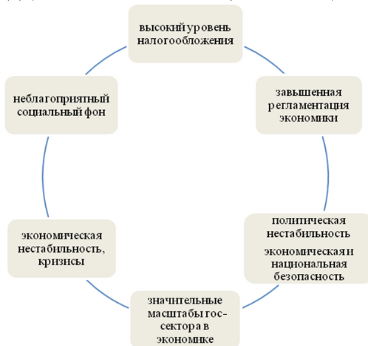
Рис. 2. Факторы появления теневой экономики

вой экономики влияют экономическая свобода и граничащая с вседозволенностью деформация морально-этических требований.