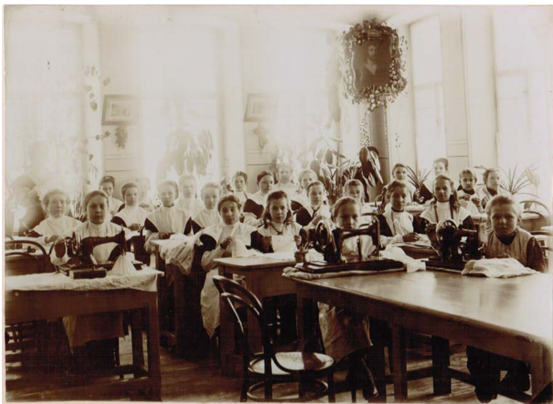
Рис. 3. Рукодельно-ремесленный класс

городницкой школы: «Соединение начальной школы и ремесленного отделения с общеобразовательным при нем курсом представляется самым жизнеспособным и желательным типом начальной народной школы. Такие школы, поднимая общее развитие учащихся, в то же время дают им в руки ремесло, обеспечивая трудовую безбедную жизнь детей бедняков» [11, с. 5].