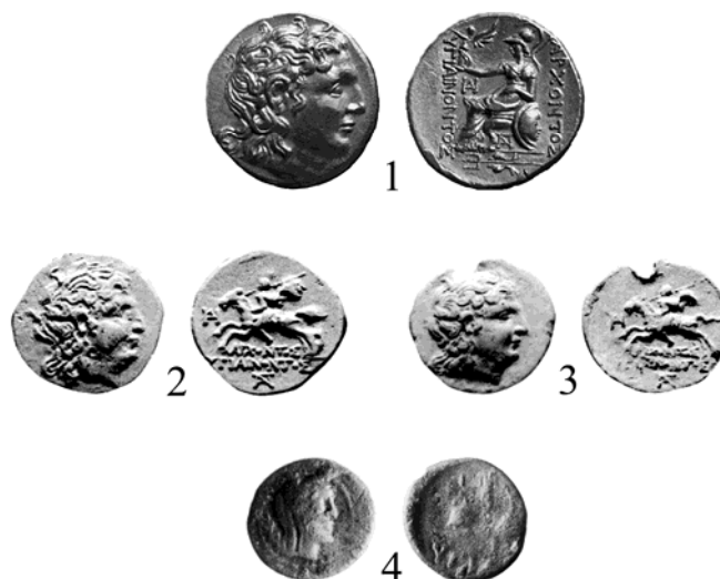
Рис. 1. Монеты архонта Гигиэнонта: 1 – статер; 2, 3 – драхмы; 4 – тетрадрок

Есть основания провести аналогию между Гигиэнонтом и Асандром [33, с. 456–487; 34, с. 119–124]. По всей видимости, они оба достигли верховной власти в Боспорском государстве благодаря удачно проведенным военным кампаниям 7 .