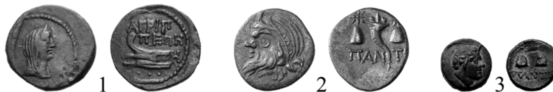
Рис. 4. Бронзовые боспорские монеты с изображениями Афродиты Апатуры (1), а также шапок Диоскуров (2, 3) на реверсе

Однако результаты этих нумизматических исследований достаточно умозрительны. А позднейшие из них во многом основывались на выводах А. Сейрига, сделанных в результате изучения реплик золота и серебра Лисимаха чекана Византия [53, р. 183–199, pl. 23, 4, 7–10, 13, 17], в нашем случае – неприменимых. Нами уже отмечено, что выпуски Гигиэнонта нет оснований считать подражаниями золоту и серебру с именем этого македонского государя. Так что для их датировки следует задействовать местные, боспорские источники исторической информации. В первую очередь – археологические.