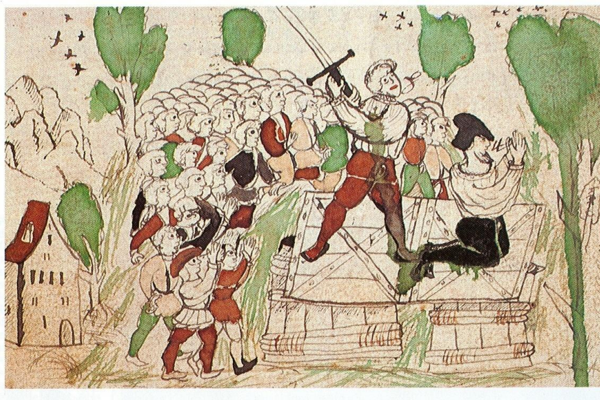
Рис. 2. Казнь Ганса Вальдмана на миниатюре из «Höngger Bericht»