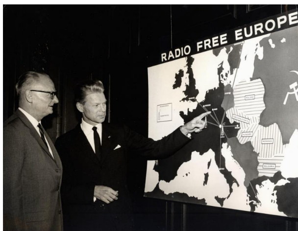
Рис. 2. Директор «Радио Свободная Европа» Родни Смит (Rodney Smith) (слева) и американский генерал, главнокомандующий объединенных вооруженных сил НАТО в Европе Лорис Норстад (Lauris Norstad) перед картой вещания радиостанции