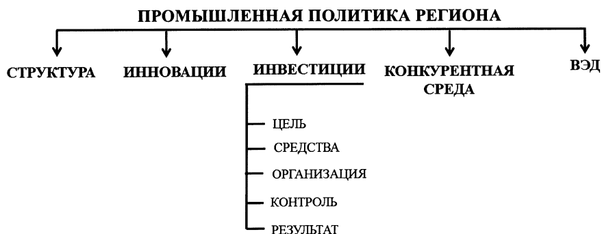
Рис. 3. Промышленная политика региона

В заключение еще раз отметим: для того чтобы у российской промышленной политики появилась территориальная проекция, а следовательно, и перспективы дальнейшего качественного развития, необходимо следующее.