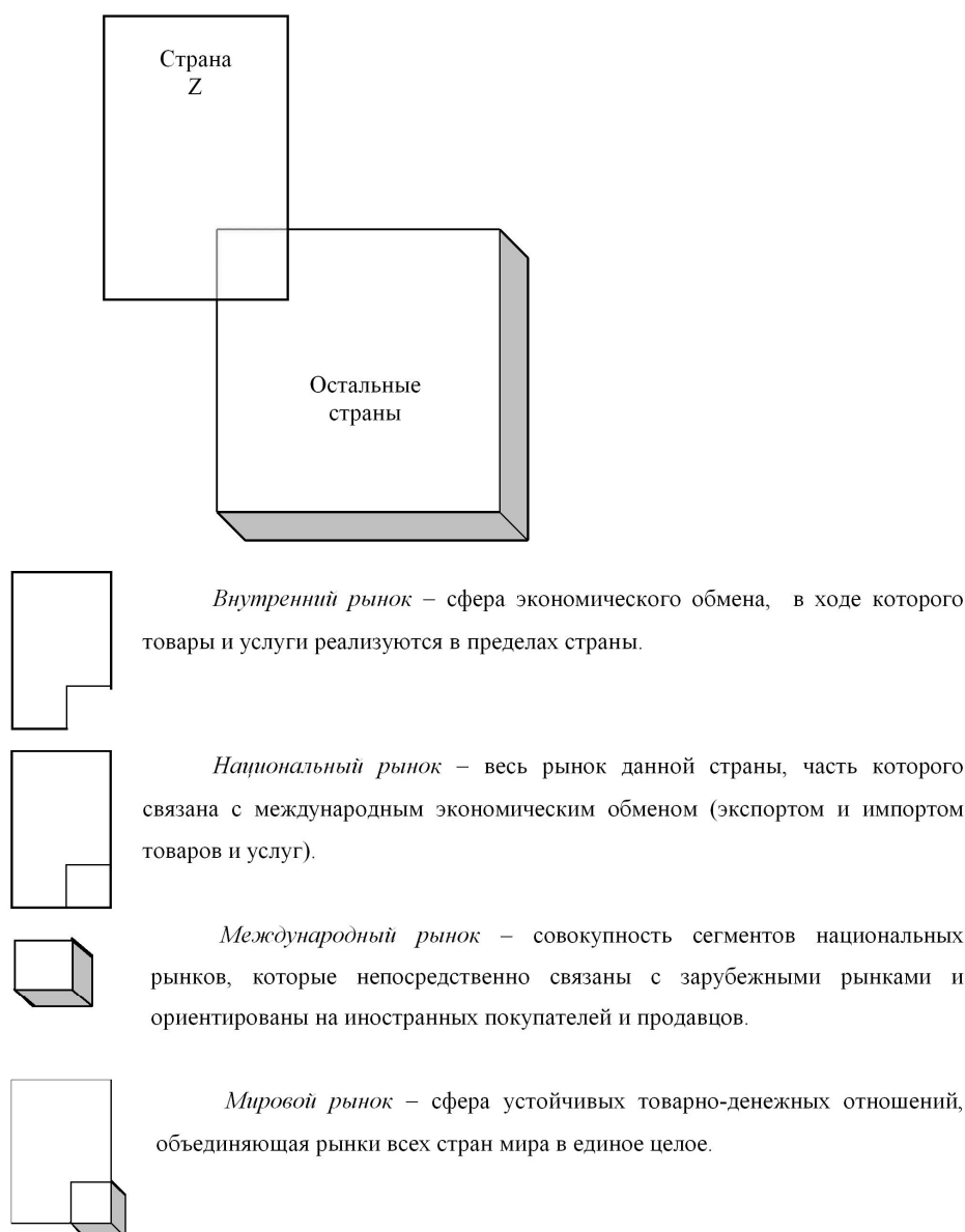
Рис. 1. Эволюция форм рынка

народной специализации, экспорт которой более чем на 60% определяется вывозом энергоносителей и другого сырья.