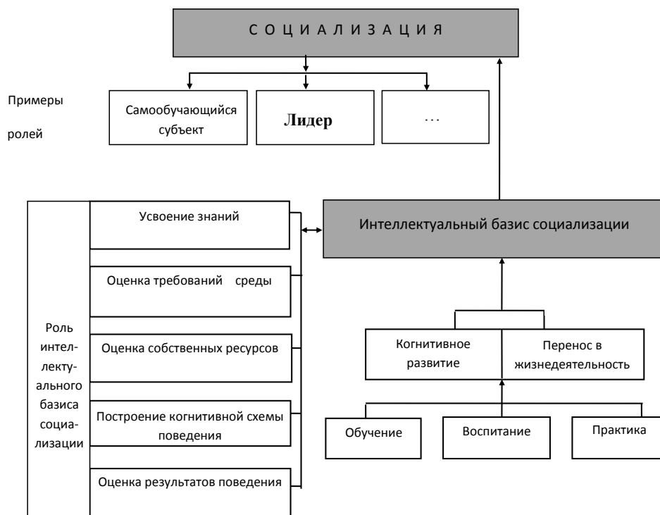
Рис. 2. Роль интеллектуального базиса в процессах социализации личности

Педагог обладает своими ресурсами по формированию интеллектуального базиса социализации. К ним относятся, в частности, умения мотивировать, создавать модели социальных ролей, обеспечивать адекватное подкрепление, умения формировать интеллектуальную деятельность учащихся и обеспечивать перенос этой деятельности в широкий жизнедеятельностный контекст. Основные контуры предлагаемой модели схематично представлены на рис. 2.