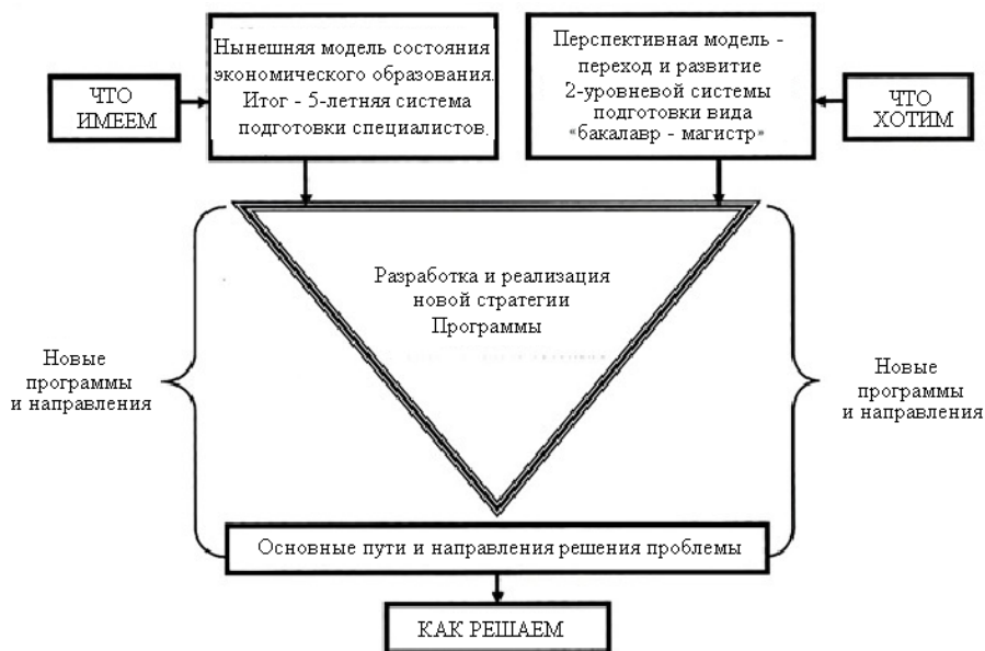
Рис. 1. Институциональная схема реструктуризации экономического образования