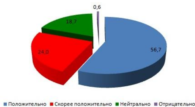
Рис. 2. Отношение студентов к волонтерству