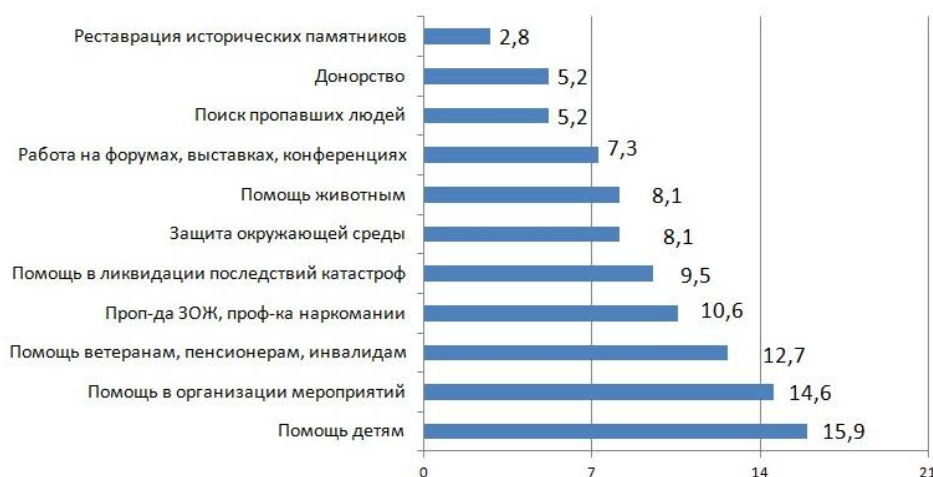
Рис. 5. Развитие направлений волонтерства в России

терством занимаются те, кто имеет возможность не работать. Зачастую волонтерская деятельность привлекает именно социально активных людей, которые стремятся реализовать в разных сферах.