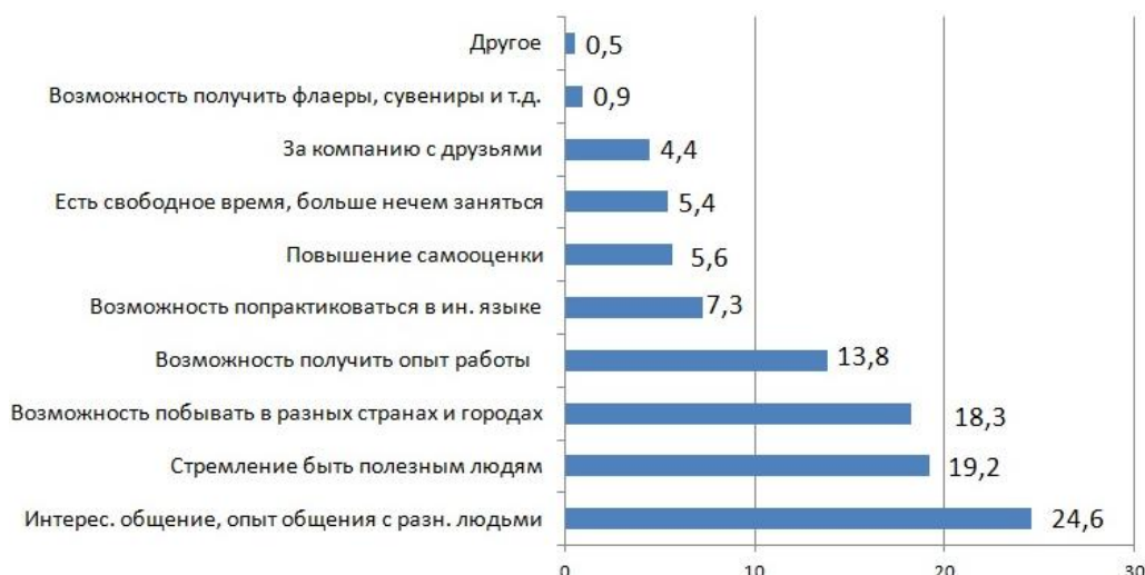
Рис. 4. Мотивы волонтерской деятельности среди студентов

По каким же причинам студенты не хотят заниматься добровольческой деятельностью? Большинство респондентов из тех, кто не желает работать волонтером (55%), объясняют это отсутствием свободного времени, почти трети опрошенных (29%) этот вид деятельности просто не интересен (есть другие, более интересные виды деятельности), а каждый десятый считает, что любая работа должна быть оплачиваема.