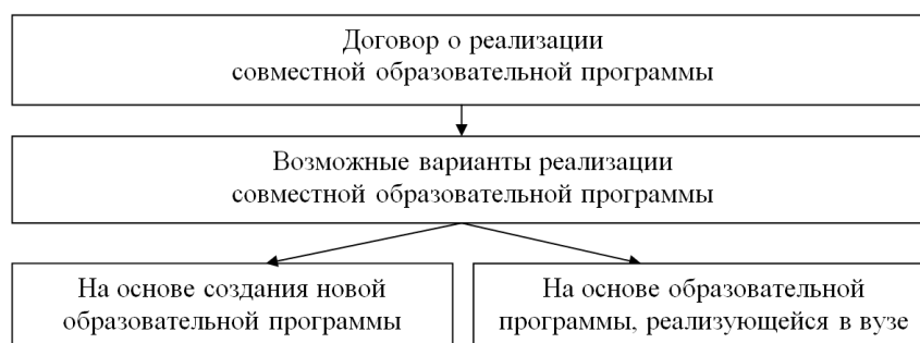
Рис. 1. Варианты реализации совместных образовательных программ [4]

Разновидностью совместных образовательных программ являются программы двойных дипломов – совместные образовательные программы, организованные и реализуемые вузом совместно с одним или более вузами (или иным учреждением, осуществляющим образовательную деятельность), завершающиеся присвоением двойных или многосторонних дипломов.