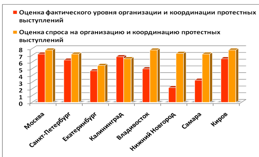
Рис. 3. Оценка фактического уровня и спроса на организацию и координации протестных действий на них