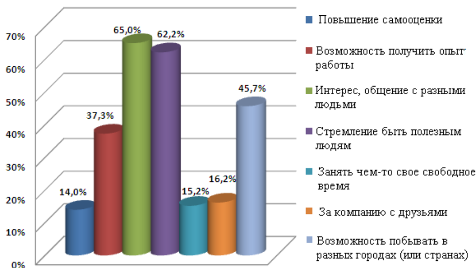
Рис. 2. Мотивы, движущие студентами в их стремлении заниматься волонтерской деятельностью