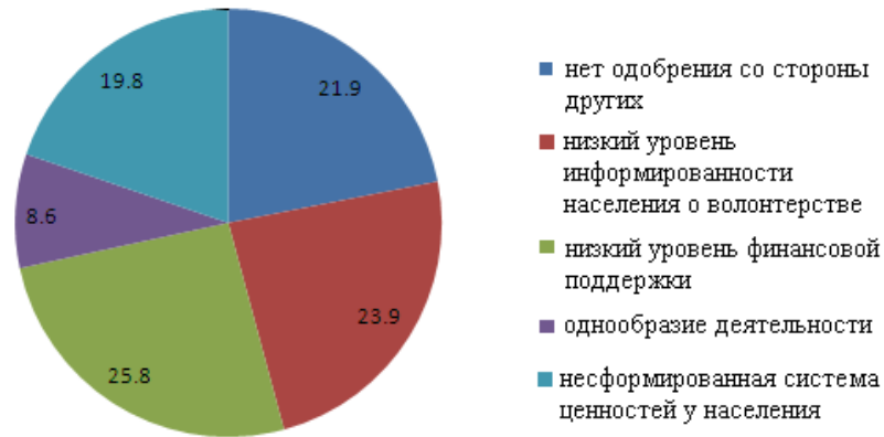
Рис. 3. Оценка причин отсутствия у молодежи интереса к социальному служению, % (n=250 чел.)

Политика государства в отношении развития волонтерства не всегда сходится с позицией самой молодежи. В опросе потенциальных волонтеров в Нижнем Новгороде нами было выявлено, что наиболее известными направлениями являются социальное, спортивное, экологическое, досуговая и творческая деятельность. Среди реальных добровольцев картина почти не меняется: 7 из 27 респондентов отметили «спортивное» направление; 5 – «социальное»; 5 – «экологическое, помощь животным»; 4 – «досуговое, творческое». Популярность спортивного добровольчества объясняется его освещенностью в СМИ в связи с Олимпиадой в Сочи, Универсиадой в Казани и подготовкой к Чемпионату мира по футболу. Социальное волонтерство на втором месте, поскольку именно оно дает наибольшее чувство полезности людям, благодарность тех, кому оказали помощь, что еще раз подтверждает выводы о мотивах добровольчества. Интересным нам показалось, что 6 действующих добровольцев не отдают особого предпочтения конкретному направлению, оказывая любую помощь в свое свободное время, то есть волонтеры становятся более универсальными и готовы оказывать помощь всем, кто в этом нуждается, даже если эта помощь не имеет точного адресата (например, сохранение памятников культуры).