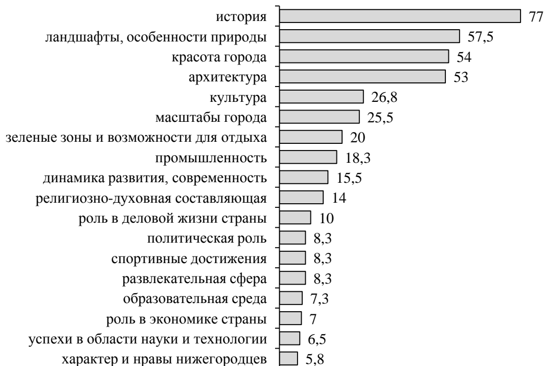
Рис. 3. Основания для гордости нижегородцев, % [15, с. 74]

подобная централизация не всегда хороша для эффективной работы сети, ведь тогда образуется то, что Бруно Латур назвал «обязательной точкой прохождения», а как показали наши исследования транспортной инфраструктуры Нижнего Новгорода, передвижения по нему, особенно в направлении центра, весьма затруднены.