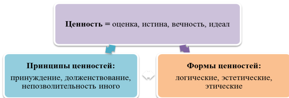
Рис. 3. Структура ценностей по Виндельбанду