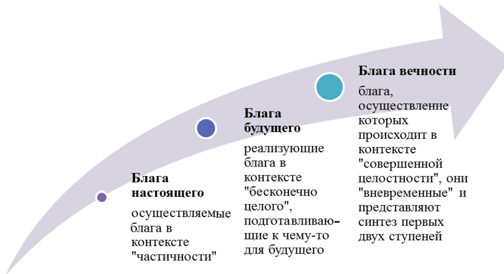
Рис. 4. «Ценностные ступени» по систематизации Риккерта

Идеализм концепции Риккерта о ценностях измеряется ее отдаленностью от реальности. Например, чем дальше произведение искусства оторвано от действительности, тем большей ценностью оно обладает (сюрреализм).