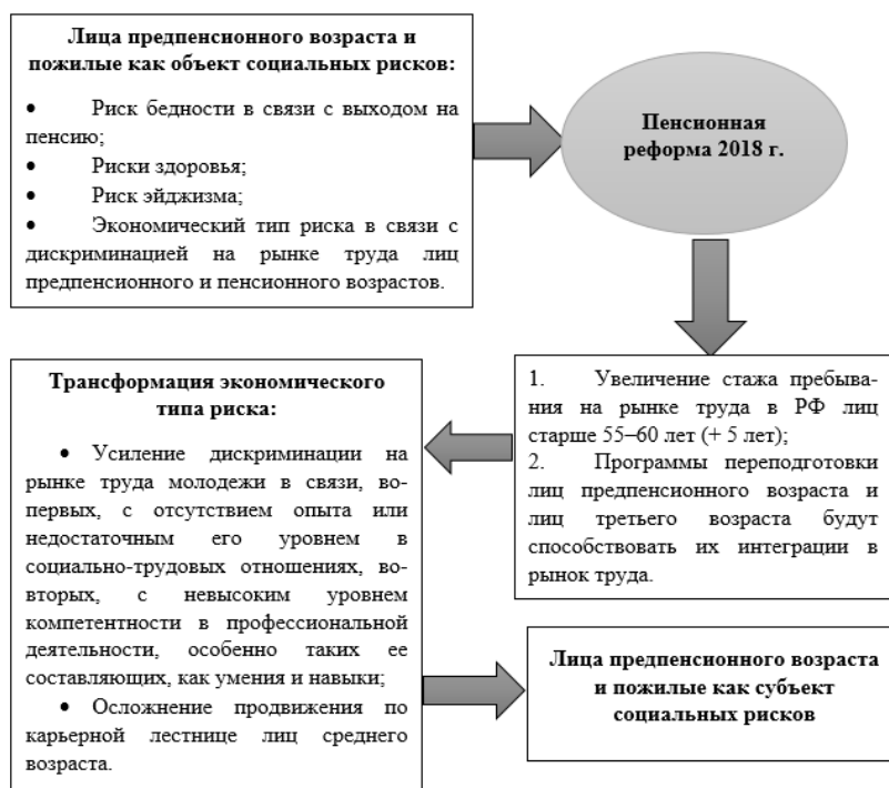
Рис. 1. Процесс трансформации лиц предпенсионного и пенсионного возрастов в субъект социальных рисков

личивают уровень смертности населения (захоронение ядерных отходов, отсутствие очистительных сооружений на многих предприятиях, повсеместная вырубка лесов, недостаточно высокий уровень обеспеченности гигиеническими технологиями в отдельных регионах Земли). Так и с пенсионным реформированием – недоступность рисков для восприятия большинством людей связана с тем, что значительная часть населения не обладает необходимыми знаниями для прогнозирования последствий пенсионной реформы для себя и для всего общества. Осознание социальных рисков – это процесс, механизм которого связан с временным критерием. Очевидно, прошло недостаточно времени, и многие негативные последствия модернизации пенсионной сферы скрыты от восприятия общественностью.