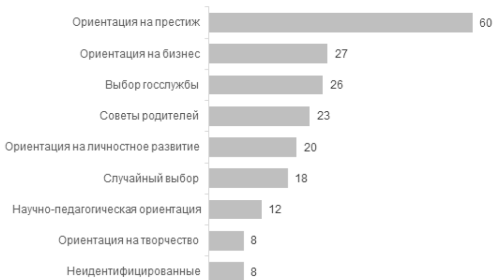
Рис. 1. Группы абитуриентов ННГУ, различающиеся ценностно-профессиональными установками, %