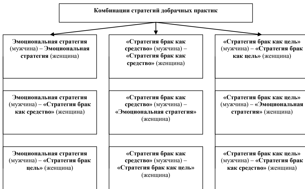
Рис. 2. Комбинации стратегий добрачных практик молодых людей

поддержке, чувстве безопасности, эмоциональном тепле и любви, является в настоящее время важной функцией. В связи с этим устойчивость брака определяется, в частности, степенью эмоциональной близости брачных партнеров и степень удовлетворения сексуальных потребностей. Все респонденты независимо от стратегии выбора партнера по браку были одинаково заинтересованы в информации о том, любит ли потенциальный супруг(-а) (49%), а также сексуальной стороне отношений с ним(-ней) (35%).