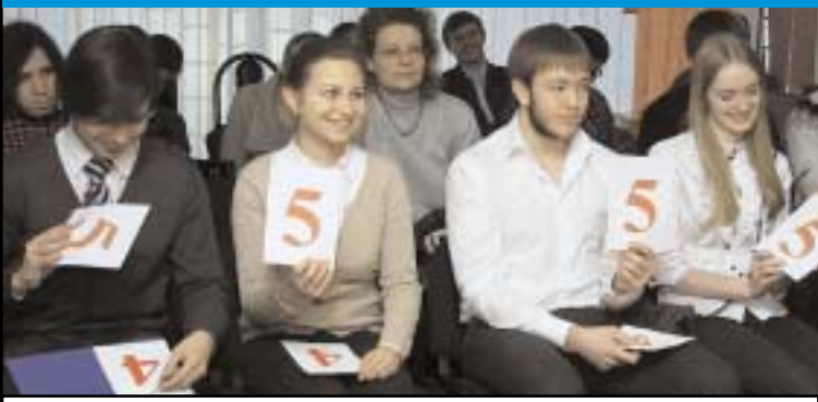
По единодушному мнению экзаменационной комиссии и зрителей, ректор ННГУ ответил на все билеты блестяще.

Ректор одного из самых авторитетных вузов России на отлично сдал экзамен своим студентам. ▼