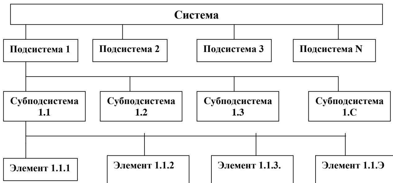
Рис.1. Структура системы

Объединяя и интегрируя приведенные выше определения и классификации, можно вывести обобщенное определение понятия «система управления».