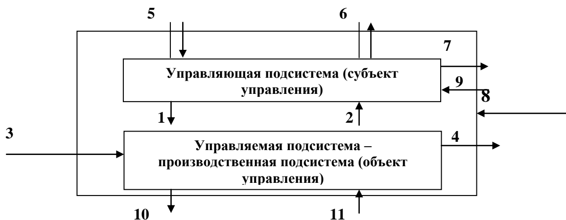
Рис.2 Модель системы управления

Простейшую модель системы управления можно представить следующим образом (рис.2):