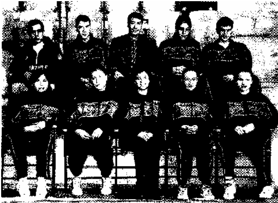
Фото 1. Команда мастеров в «Университет — Нижний Новгород»